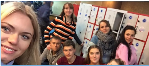
Науково-технічна та педагогічна діяльність